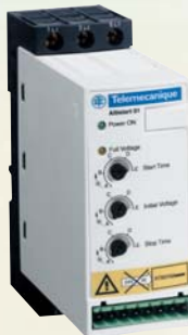
Altistart 01N2 от 6 до 32 А