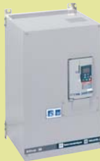
Altivar 38 0,75 - 315 кВт