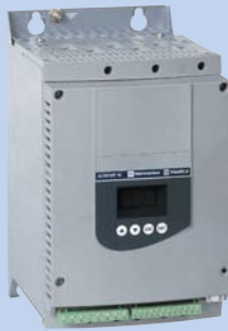
Altistart 48 17 - 1200 A