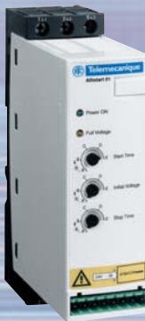
Altistart 01 модели U от 6 до 32 А