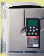
Altivar 58 0,37 - 75 кВт