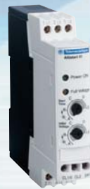
Altistart 01N1 от 3 до 12 А