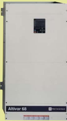
Altivar 68 75 - 630 кВт